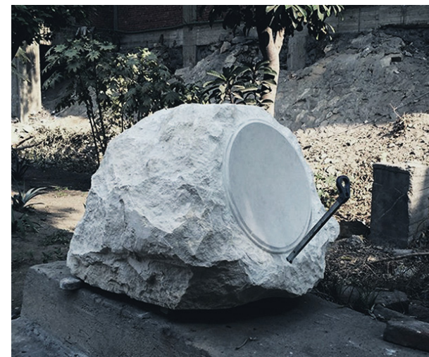
Antenne satellite de pierre, No.1, le Caire, 2015 Pierre sculptée, système de réception d'antenne parabolique, 70 X 70 X 100 cm

European Sound Delta , avec le Collectif MU : Festival Ososphère, Strasbourg - Festival The Bridge, Roussé, Bulgarie - Festival Belef, Belgrade, Serbie - Air-Antwerpen, Anvers, BE - City Museum, Vukovar, Croatie - Festival Citysonics, Mons, BE- V2, Rotterdam, PB